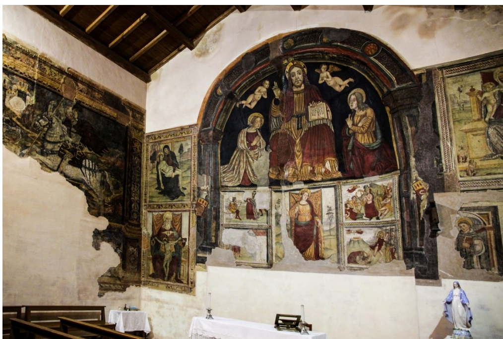
Figura 8 Affreschi sulla parete est della chiesa di Santa Caterina d'Alessandria, Cancellara.