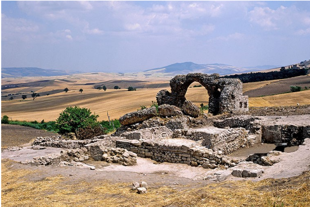
Figura 2 Insediamento sul Monte Montrone, Oppido Lucano.