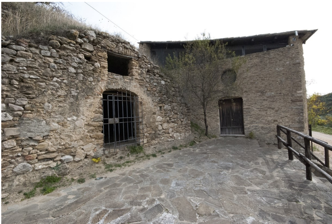
Figura 3 Chiesa di Sant'Antuono, Oppido Lucano.