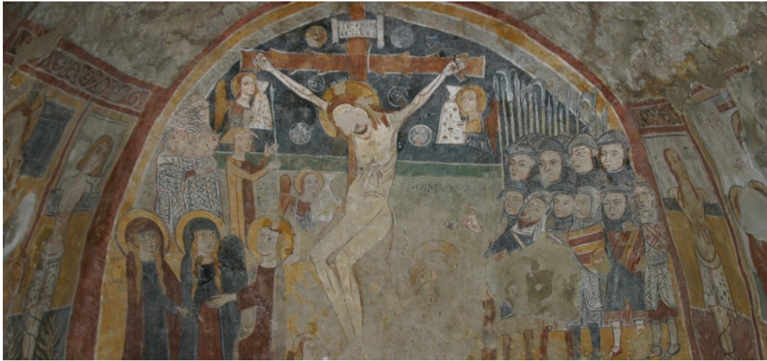
Figura 4 Affreschi all'interno della chiesa rupestre di Sant'Antuono, Oppido Lucano.