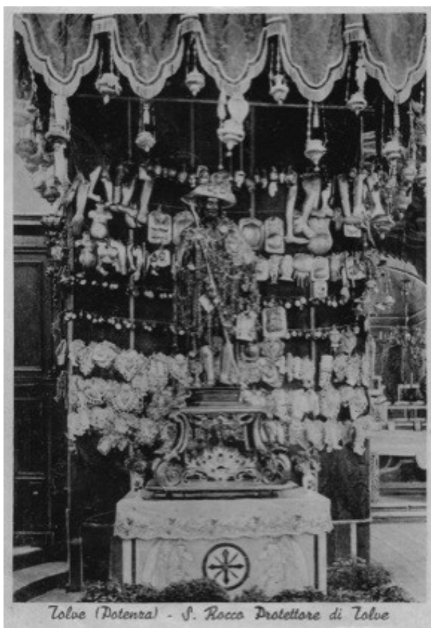
Figura 13 Cartolina risalente ai primi del Novecento, mostrandone la statua del santo ricoperta d'oro esposta con un gran numero di ex-voto.