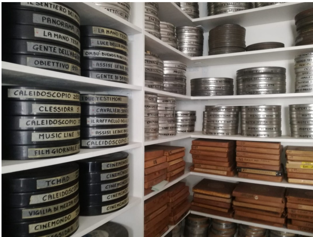
Figura 6 Alcune pellicole della Cineteca Lucana, Oppido Lucano.