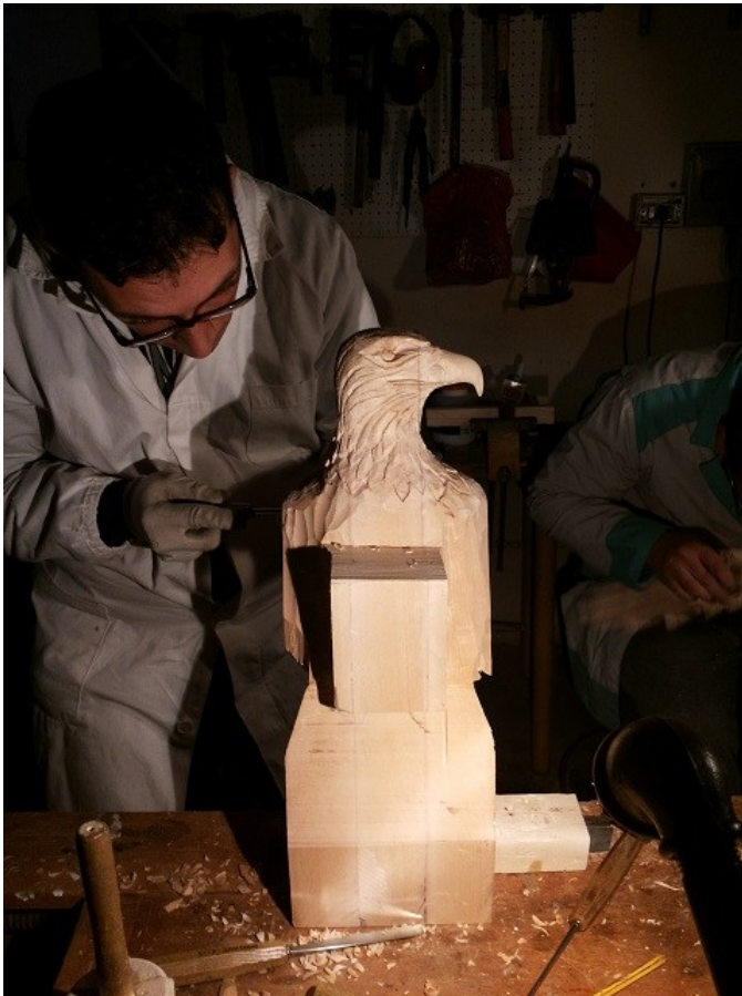
Figura 5 Lavori di realizzazione di una biga romana per la Preggessione a cura del GRTL.