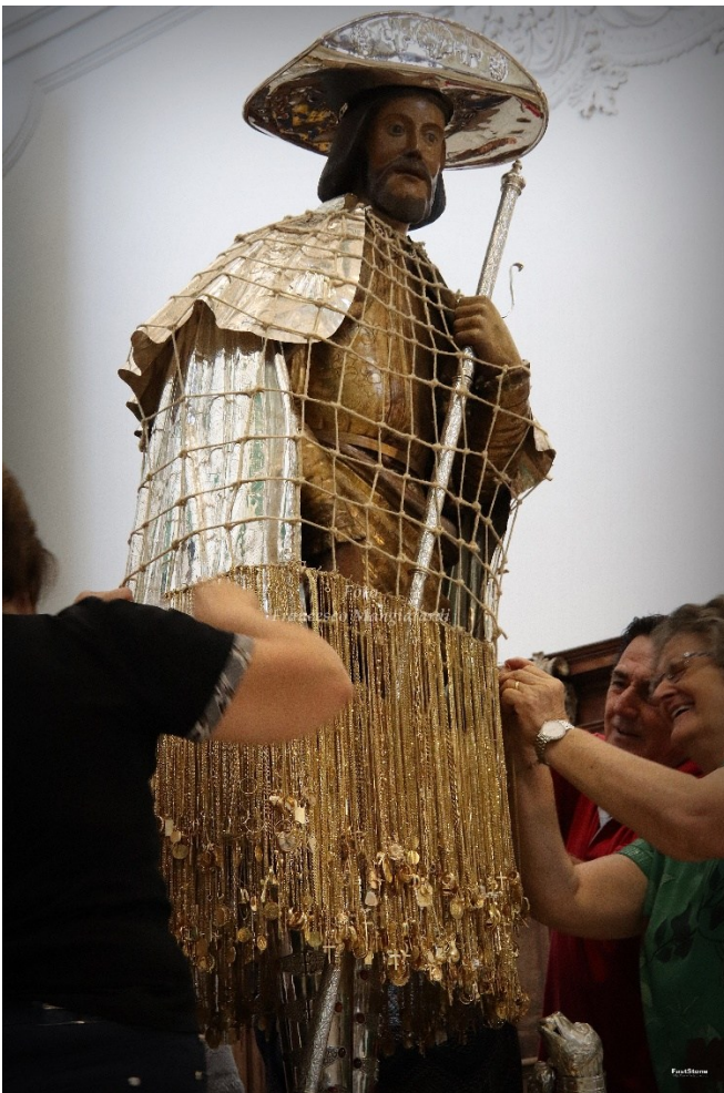
Figura 12 Vestizione di San Rocco, Tolve.