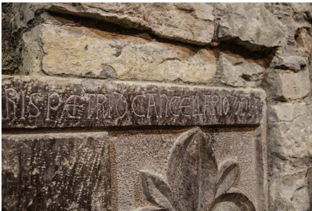
Figura 7 Epigrafe sulla parete ovest della chiesa di Santa Caterina d'Alessandria, Cancellara.