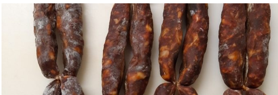
Figura 10 La salsiccia a catena di Cancellara.