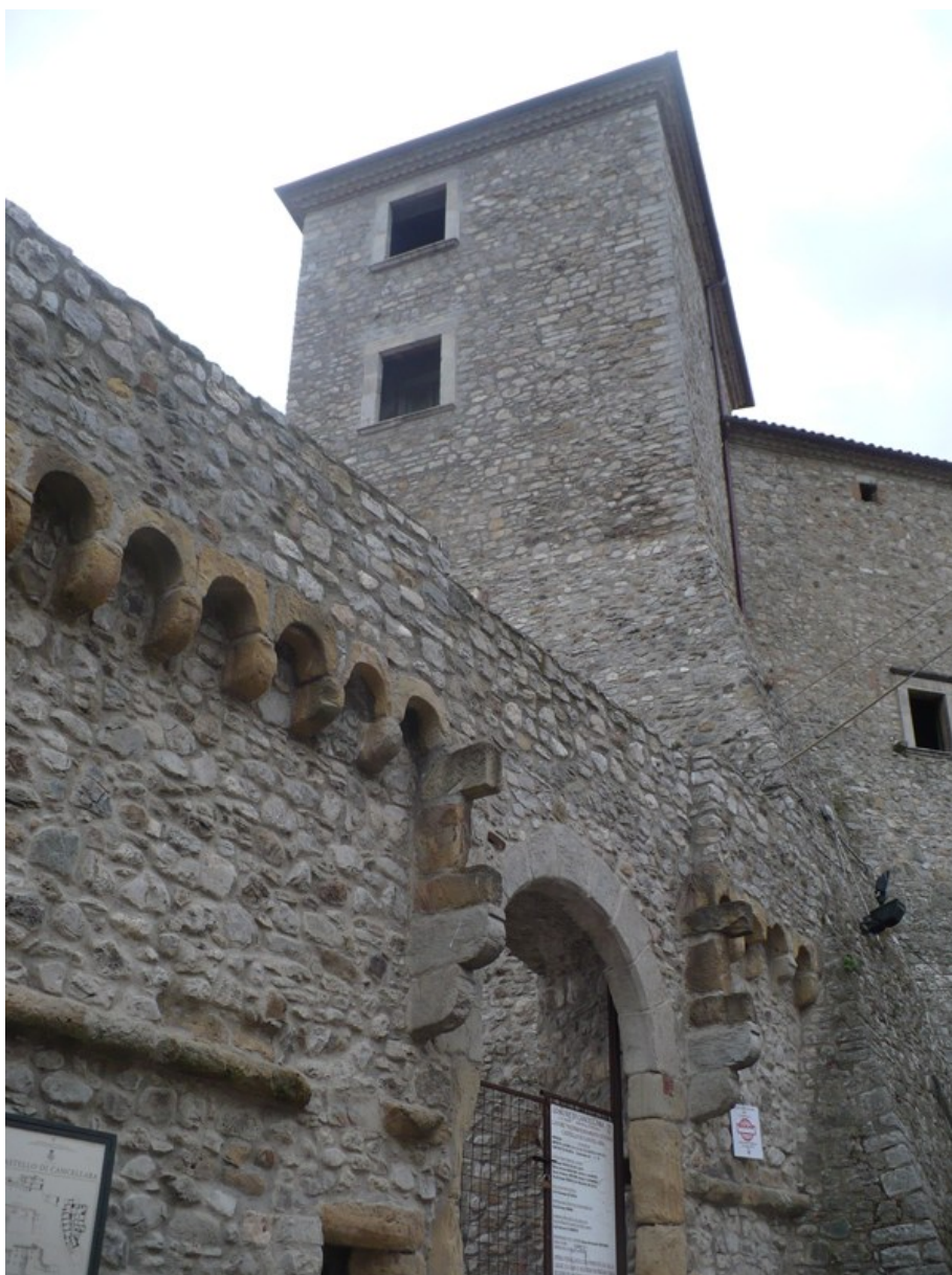
Figura 9 Torre e cinta muraria del castello di Cancellara.