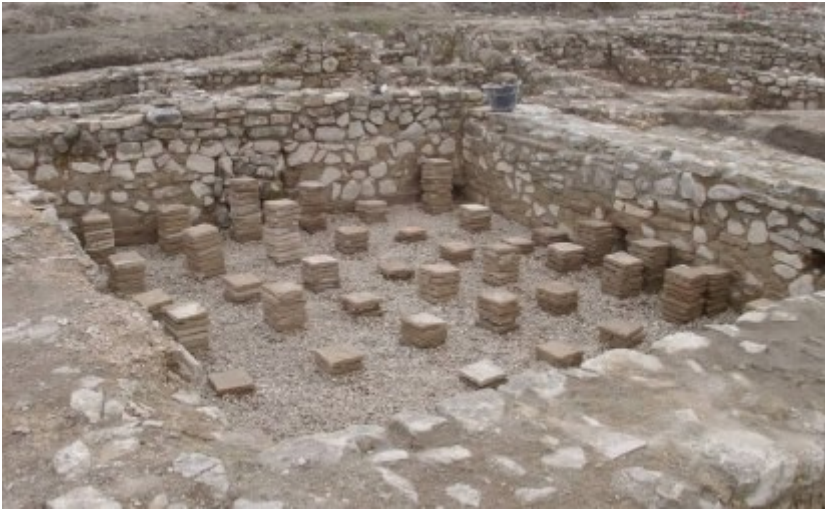
Figura 11 Villa Romana di San Pietro, Tolve.